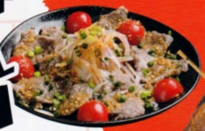
ちよいほろ酒場 ガガトン 【シカの冷しゃぶサラダ】