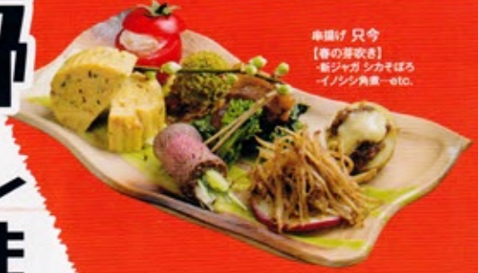
串揚げ 只今 【春の芽吹き】 -新ジャガ シカそばろ -イノシシ肉串-etc.