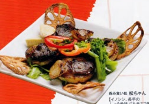
呑み食い処 松ちゃん 【イノシシ、長芋の しょうゆ味ハルサミコ風味】