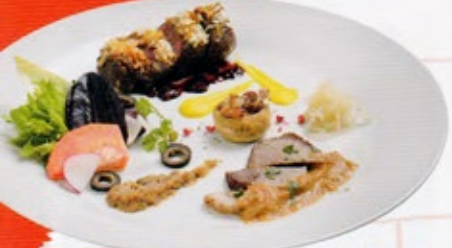
しまんりよ Pod 【イノシシプレート】 -イノシシのステーキ かばちゃんソース -イノシシのストラウコット-etc.