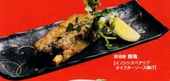
居酒屋 鶴亀 【イノシシベアリブ オイスターソース揚げ】