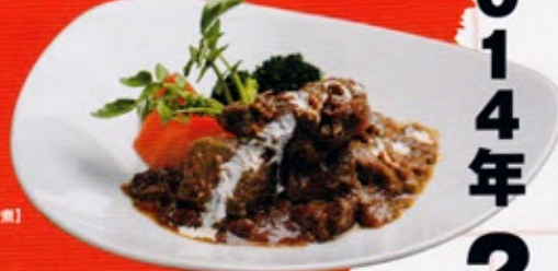
欧風酒場 ヴァンドール 【シカの赤ワイン煮】