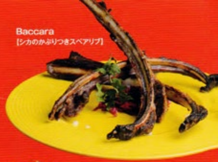
Baccara 【シカのかぶりつきスベアリブ】