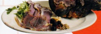
※料理の写真は、 イメージです。