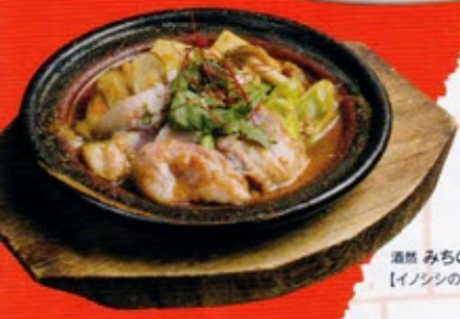
酒然 みちのか 【イノシシの信州みそ焼き】